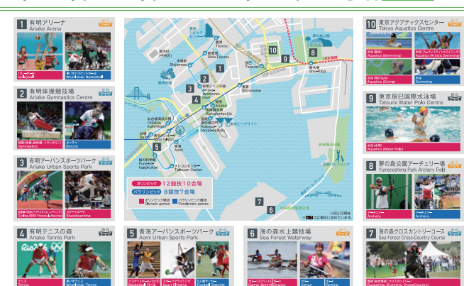
江東区内会場配置マップ