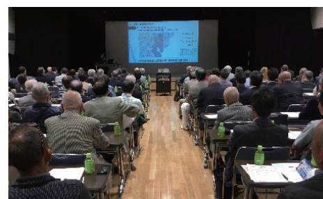
1年間の議会活動を報告

私が活動の拠点とする白河管内では、この4年間で人口が約3千人、児童数が約4百人と人口増加を続け、来訪者も増加傾向にあります。それに伴い、歩道通行量や一方通行の逆走車が更に増加し、抜本的な交通安全対策やコミュニティスペースを拡張する必要性など、種々の課題が生じております。今年も地域の動向に注視し、必要な施策を提案し実現して参りたいと決意しております。