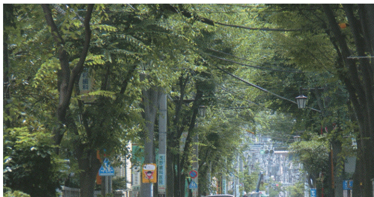
深川江戸資料館通りの街路樹

相次ぐ大規模水害への備えや震災時の火災による延焼が懸念される地域の不燃化促進など、区民の生命・財産を守る基礎自治体として防災都市江東の推進を図ると共に、隣接区(墨田・足立・葛飾・江戸川)と江東5区広域避難推進協議会を設置し、「江東5区大規模水害ハザードマップ」を公表しました。大規模水害時の広域避難を具体化するため、判断基準、対象者の絞り込み、移動困難者対策等の検討を更に進めていきます。