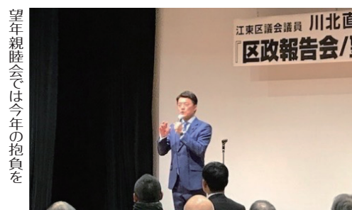
望年親睦会では今年の抱負を